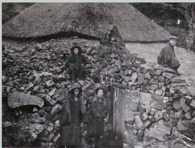
蚕種紙の低温貯蔵庫として使用された月山風穴 大正時代撮影 個人蔵