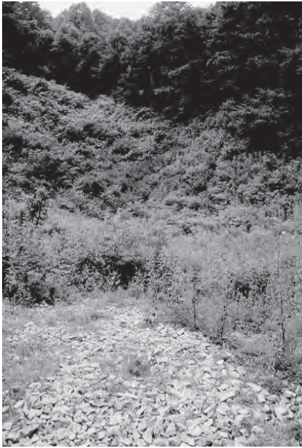
天童市ジャガラモガラ

現在では山の中に放棄され、場所の特定すら難しく、同時に、人びとの記憶からも消え去ろうとしています。本展では、山形県内の風穴、特に月山や高畠での養蚕業と風穴の結びつきに焦点をあてます。風穴を産業遺産として捉え、日本の産業振興に貢献した先人たちの知恵に想いを馳せる機会となれば幸いです。