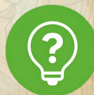
探究ヘルプデスク